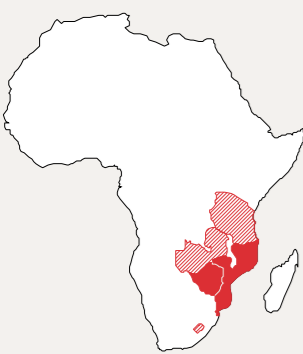
Zimbabwe Offen für moderne Verhütung

Der partizipative Ansatz eines lokal produzierten Filmes bringt die Bevölkerung dazu, über ihre Erfahrungen zu diskutieren. Dieser Dialog hilft, tradierte Ansichten zu hinterfragen und ebnet den Weg für eine bessere sexuelle Gesundheit.