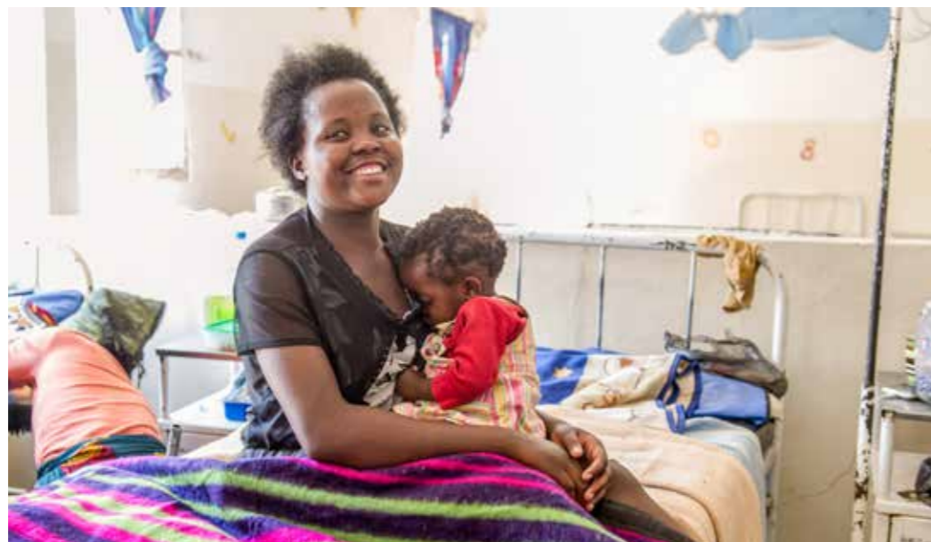
Bild Seite 3 Wartende Mütter mit ihren Kindern vor dem Spital in Chiúre. Die Kindersterblichkeit in den überfüllten Notaufnahmen im Norden Moçambiques ist erschreckend hoch.

Nachdem die Erfolge dieses Triage-Projekts nun auch wissenschaftlich validiert sind, führt SolidarMed die Farbkarten auf den Notfallstationen in zwei weiteren zentralen Spitälern in Metoro und Pemba ein.